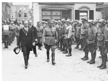
Burgemeester Ficz inspecteert de troepen in 1938 op de Hoofdwagt.