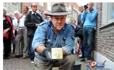
Gunter Demnig toont de Stolperstein voor Dina.

Stolpersteine of 'struikelstenen' zijn gedenktekens op het trottoir voor de huizen van mensen die door de nazi's verdreven, gedeporteerd of vermoord zijn. Stenen waarover je 'struikelt met je hoofd en je hart en waarbij je moet buigen om de tekst te kunnen lezen'. Stolpersteine zijn een idee van de Duitse kunstenaar Gunter Demnig. Hij heeft er in heel Europa al tienduizenden gelegd.