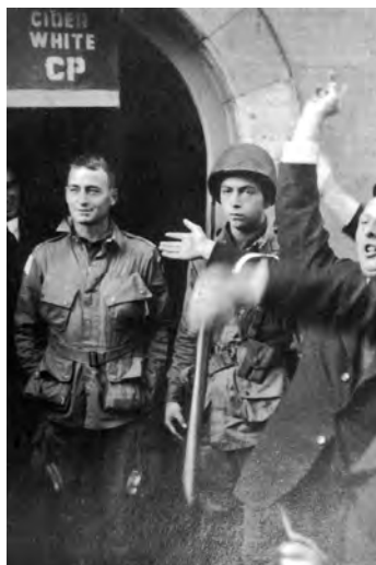
18 september 1944 wordt in het historisch stadhuis commandopost Cider White gevestigd.